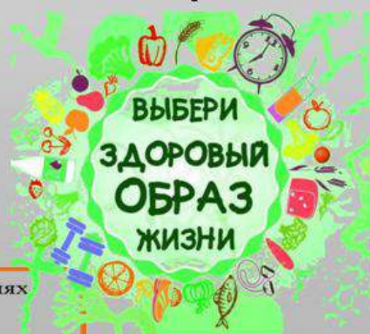
Результаты осведомлённости о требованиях ЗОЖ 8-11 классы